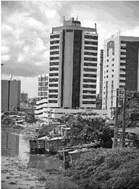
Disponível em: < http://www.moradiacentral.org.br/index.php?mpg=08.03.03 >. Acessado em: 20/08/2011